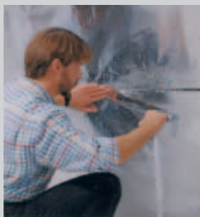
Collage des joints du pare-vapeur TECHNORM