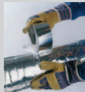
Fixation l'isolation de tuyau