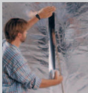
Collage de panneaux stratifiés en aluminium