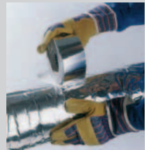
Fixierung von Rohrisolierungen