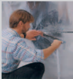
Nahtverklebung der Dampfsperre TECHNORNORM

• AWX – All-Weather-Quality Aluminiumklebeband mit hervorragender Klebkraft auf metallischen bzw. kondensatragenden Untergründen. Verarbeitbar bei Frost und Temperaturen bis -25 °C. Hitzebeständig bis +130 °C. Brandverhalten DIN 4102 B1, schwer entflammbar.