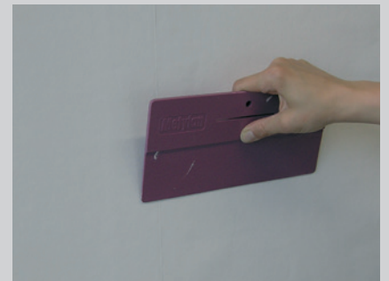
Vaporex Dampfsperre über dem PA2-Aluband auf Stoss verkleben