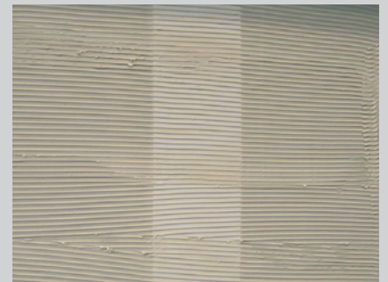
Superwand Kleber von Korff auf Bahnbreite aufspachteln