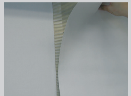
Blasenfrei andrücken (z. B. mit einem Tapezierspachtel)